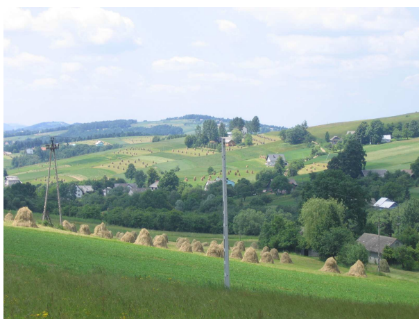
Lato – Koniuszowa w czasie żniw