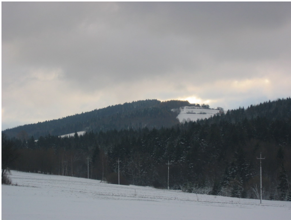
Widok na Jodłową Górę