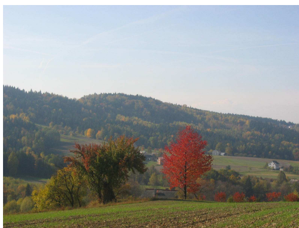
Widok na Murzeń