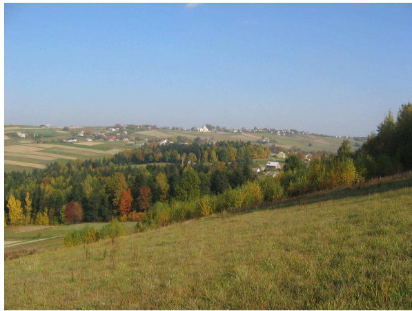
Widok z Podlasu na Mogilno