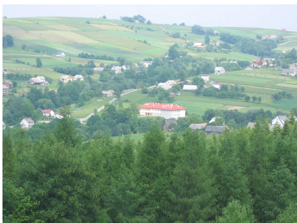
Widok na Koniuszową z Murzenia