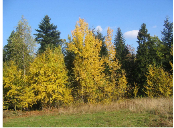
Las od strony przysiółka Podlas