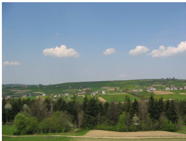
Wiosna - widok na Koniuszową z Lipia