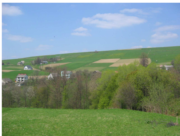
Wiosna - widok na Pótrołki