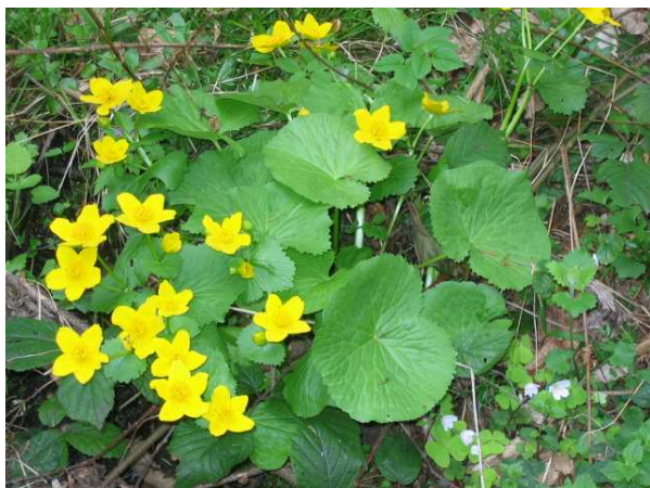
Kaczeńce na „mocarach”