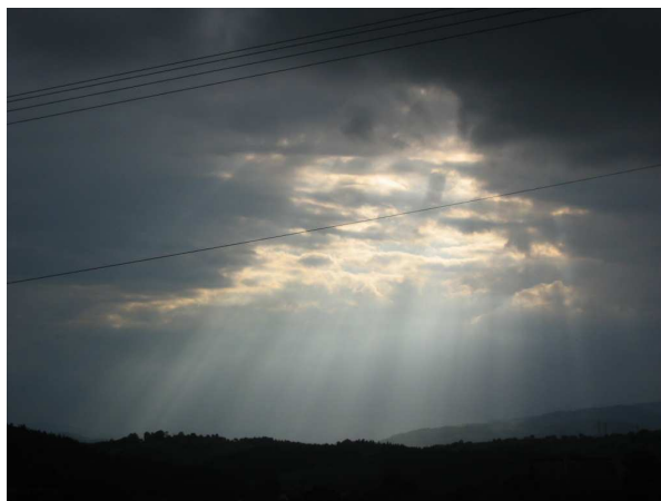
Tajemnica chmur nad Koniuszową