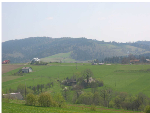
Widok z Pótrołek na Koniuszową i Jodłową Górę