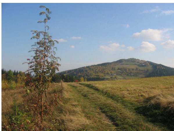
Widok z Lipia na Jodłową Górę