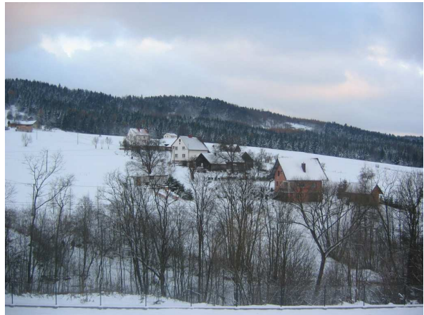
Widok na Murzeń